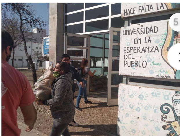
Activar. Es la consigna de la campaña Activemos Córdoba solidaria, que ahora vuelve a tomar notoriedad. (UNC)