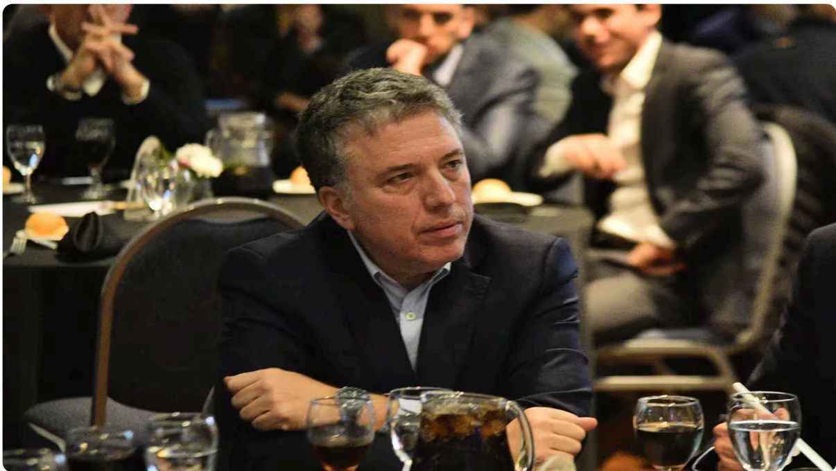
Un nuevo horizonte de crecimiento en la Bolsa de Comercio de Córdoba.

En el marco del ciclo “ Nuevo horizonte de crecimiento ”, se realiza desde las 13 el tradicional almuerzo de la Bolsa de Comercio de Córdoba.