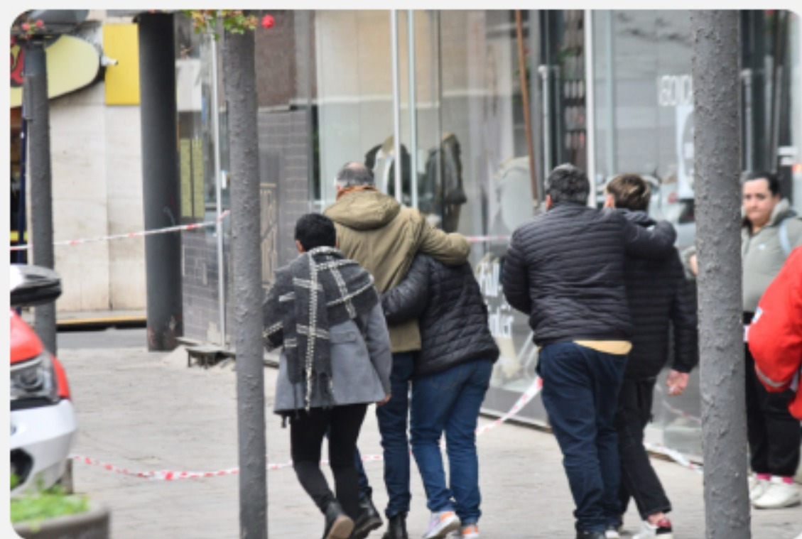
Tragedia en un edificio céntrico. Cuatro personas murieron tras incendiarse un departamento.