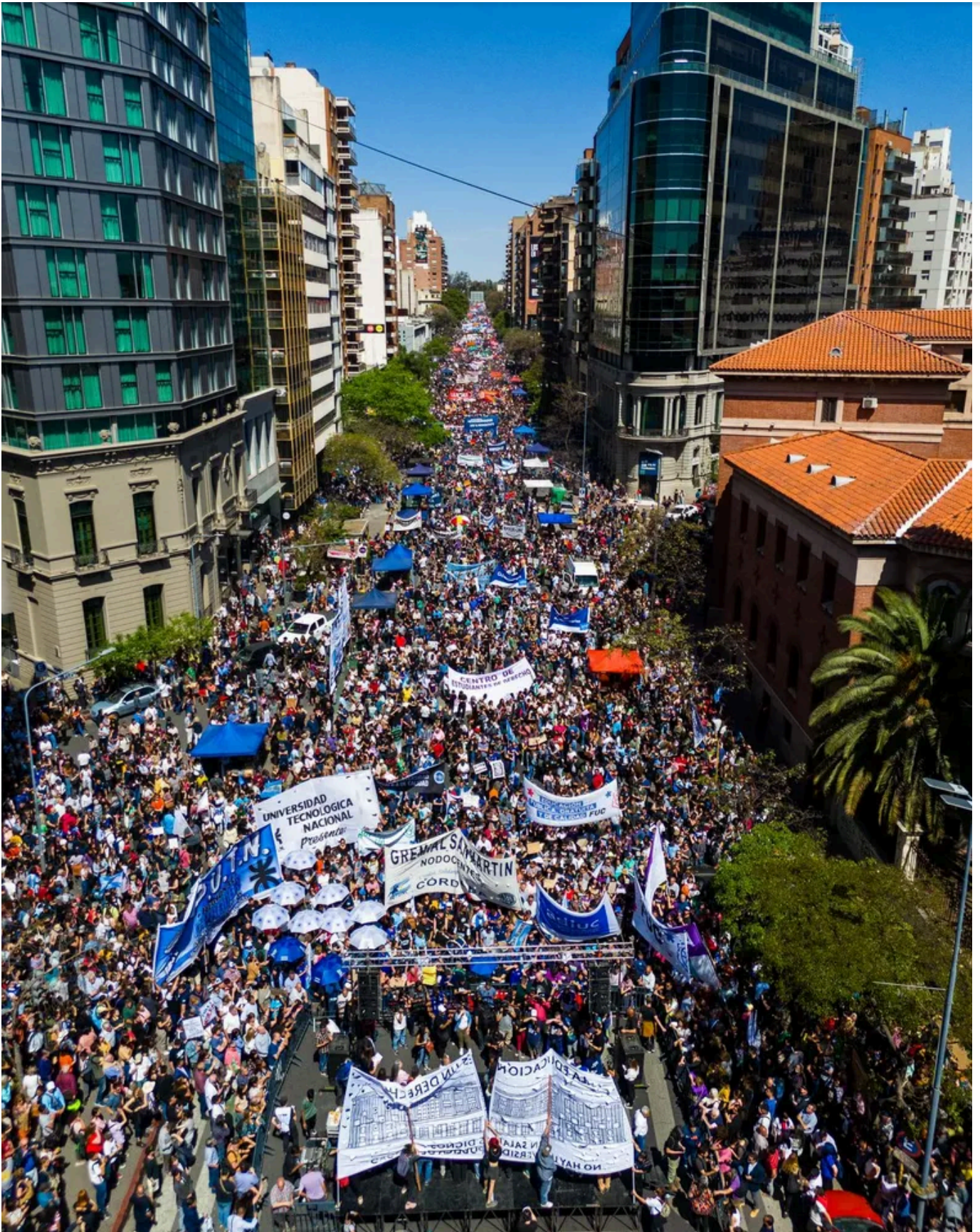
Unas 100.00 personas se movilizaron en Córdoba a favor de las universidades públicas.

Sin embargo, Alfano Villalba no teme por posibles “oleadas de violencia” y justifica su presunción: “si el Gobierno nacional no lo hizo en las contundentes marchas del 23 de abril y del 3 octubre pasado, con más de 100.000 personas en las calles de la docta, no creo que lo haga ahora”.