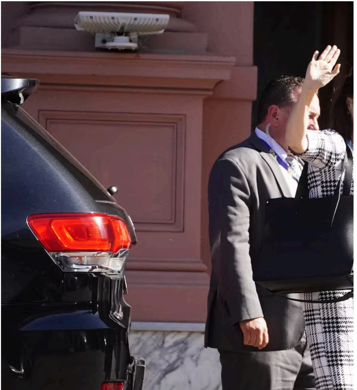
El voto favorable a Cuba "le costó el puesto en 30 minutos" a Mondino, dijo Milei