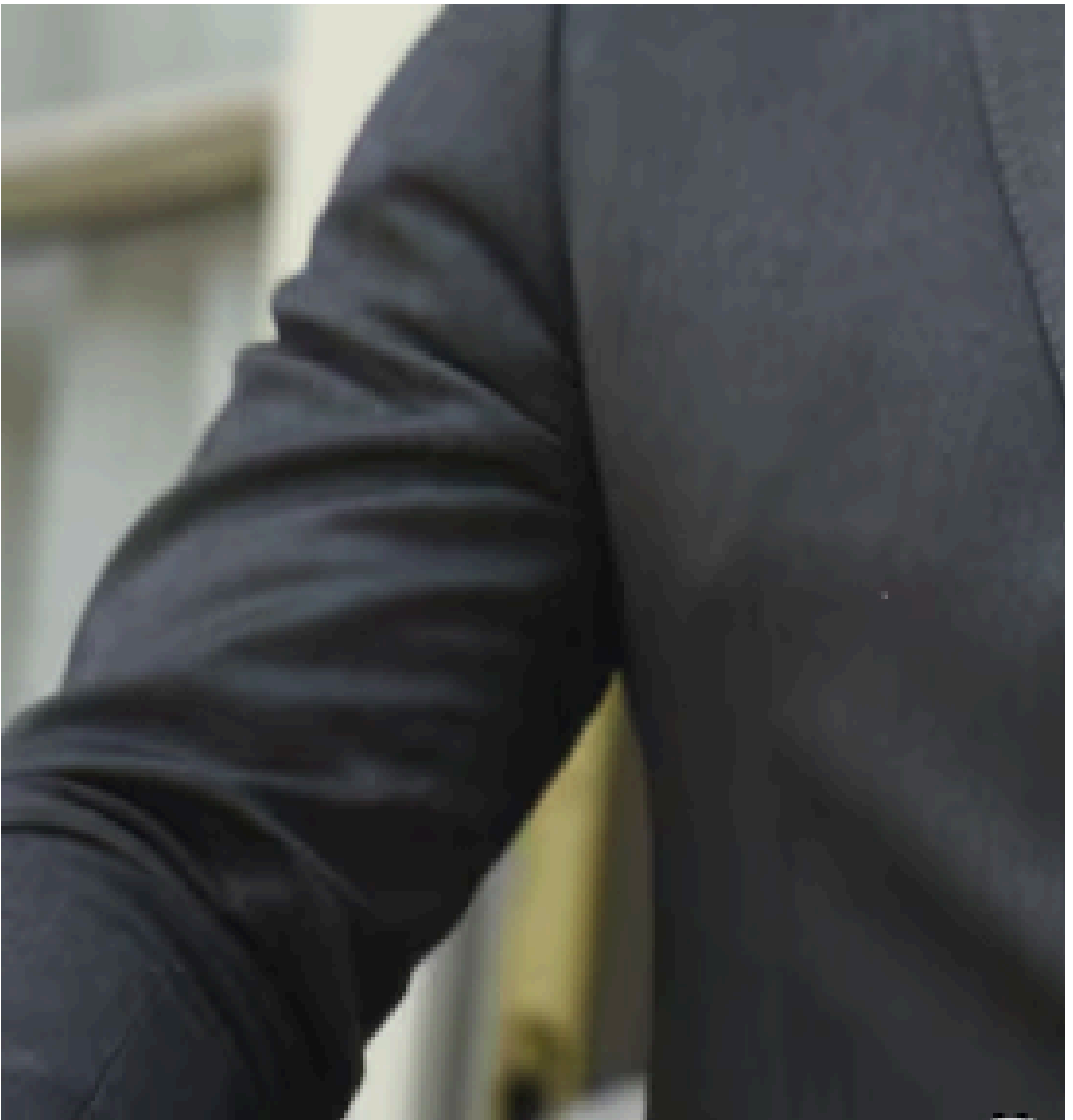
El presidente Javier Milei junto a Diana Mondino

Sin embargo, Mondino aún no se expresó sobre este ofrecimiento público . “Hay que ver si quiere, quedó muy golpeada”, señalaron fuentes gubernamentales a Infobae .