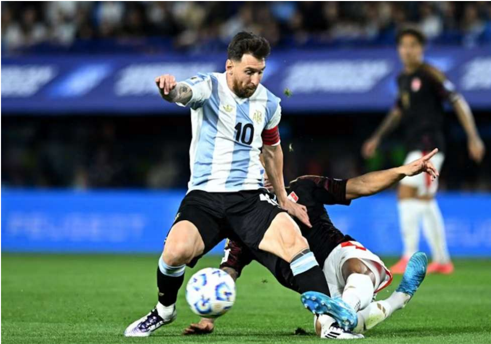
Lionel Messi cubre el balón durante el partido de la eliminatoria sudamericana entre Argentina y Perú

Otro nombre destacado del listado es el de Lionel Messi , que ocupa el puesto número 30 con un patrimonio personal de USD 950 millones . “El ser humano vivo más famoso del mundo y el argentino más reconocido de la historia tuvo ingresos formales de USD 1.500 millones hasta junio del 2024, pero su patrimonio se reduce por el pago de impuestos. Es el único deportista en la lista”, detacó Forbes sobre el capitán de la Selección campeona del mundo.