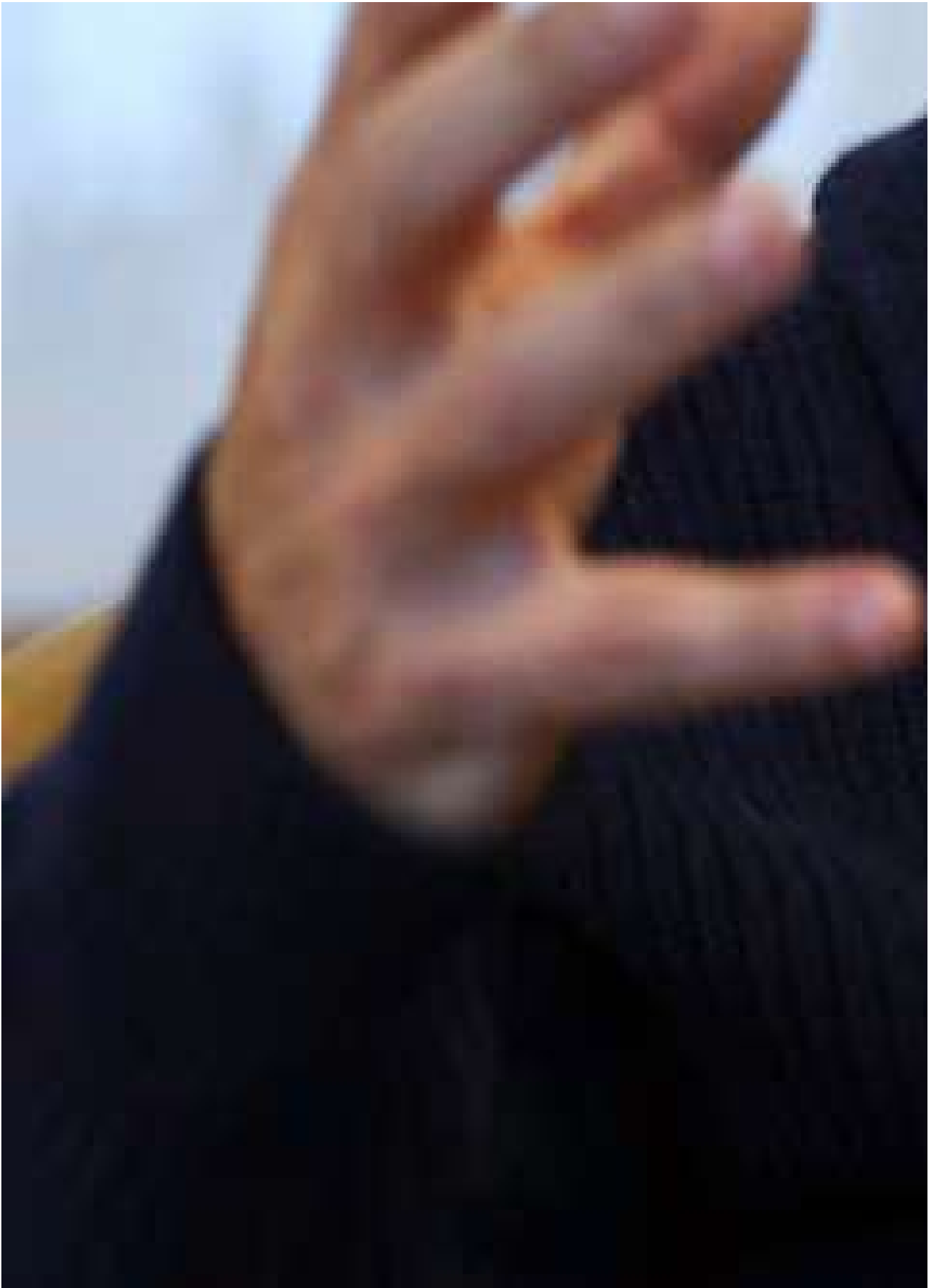
Marcos Galperin, sigue siendo el argentino más rico

El selecto grupo de los 50 argentinos y argentinas más ricos acumulan patrimonios que sumados dan casi USD 78.000 millones, 12,1% del PBI de 2023.