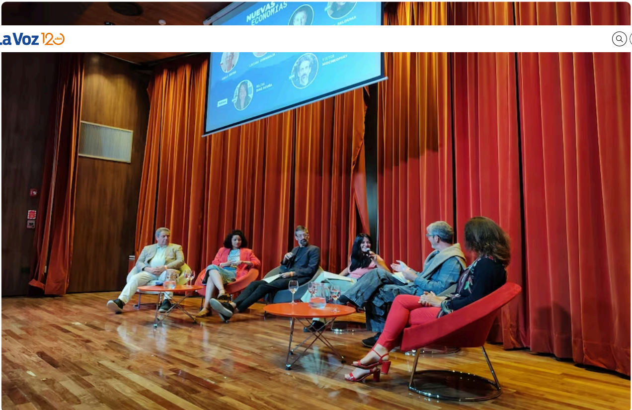
Camino hacia Futuros Posibles - 2024

Del 13 al 15 de Marzo, la ciudad será el epicentro de un encuentro único y transformador que reunirá a cientos de personas motivadas en explorar y co-crear soluciones a los grandes desafíos contemporáneos, vinculados con el futuro de las ciudades, las empresas, la educación y el dinero.