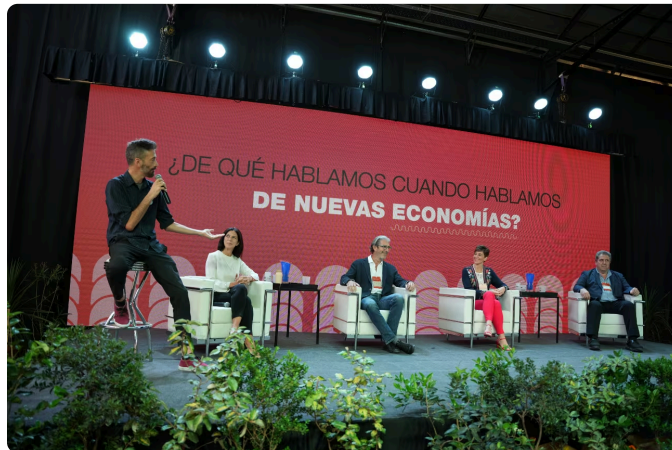
DíaB 2022 Rosario

Cabe destacar que los resultados de estas actividades serán abiertos: los casos, ideas y tendencias generadas serán sistematizados y publicados en el Reporte Futuros Posibles.